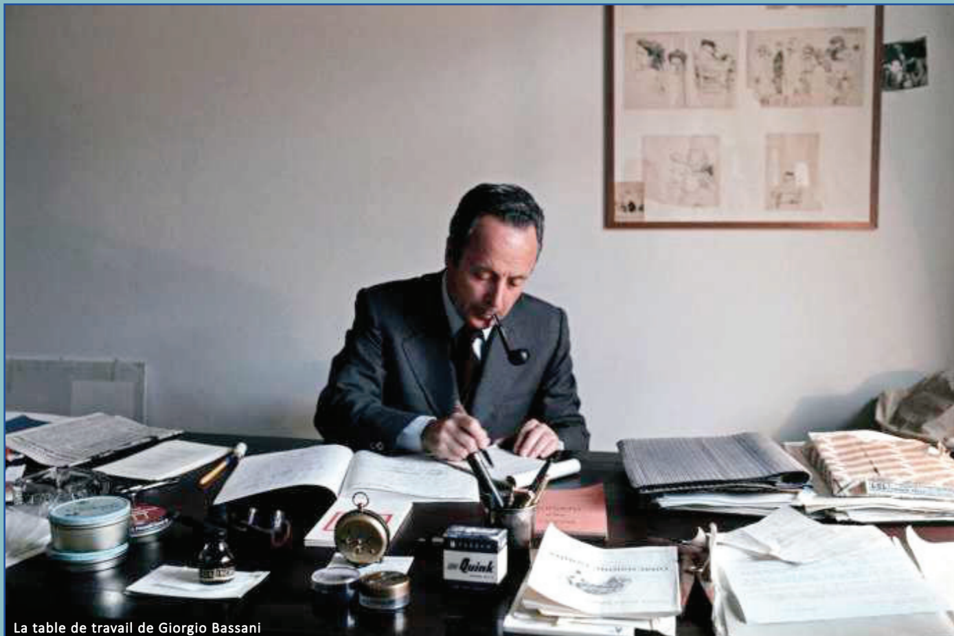
La table de travail de Giorgio Bassani

Dans ce séminaire organisé à l'occasion du centenaire de la naissance d'un des plus grands écrivains italiens du XX e siècle, deux spécialistes reconnus de cet auteur nous parleront de la genèse de son œuvre ainsi que des projets d'édition critique actuellement en cours.